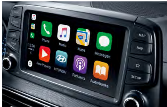
Màn hình cảm ứng 8 inch tích hợp Apple Carplay & Hệ thống định vị dẫn đường