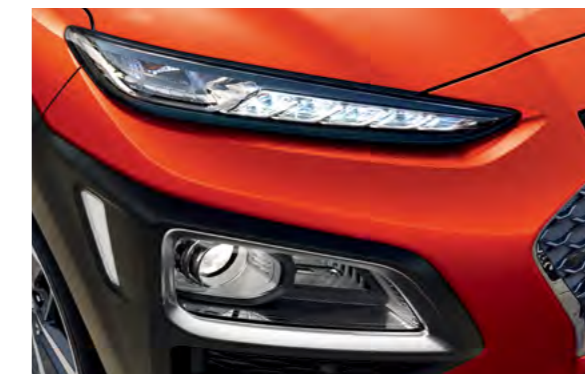
Đèn chiếu sáng Bi-LED cho 2 chế độ pha-cos