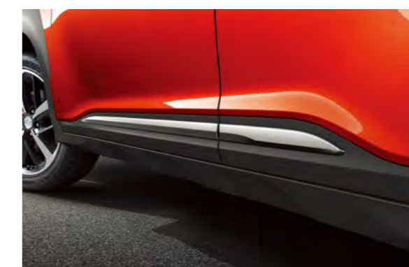
Ốp gắm thể thao