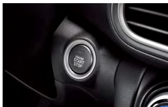
Chìa khóa thông minh kết hợp khởi động nút bấm