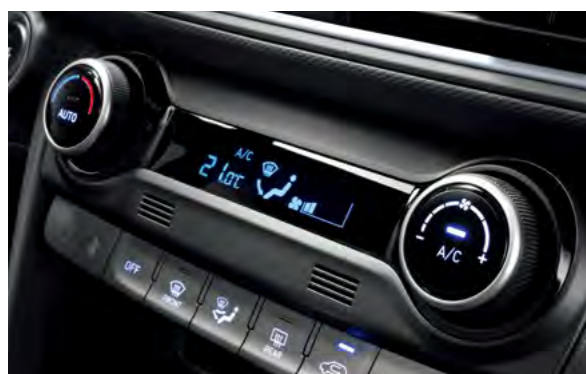
Điều hòa tự động