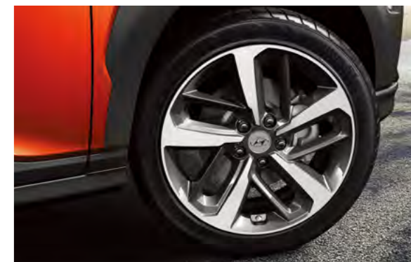
Lazang 18 inch Diamond-Cut