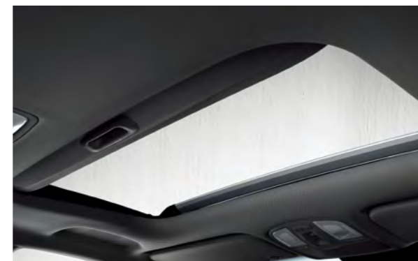
Cửa sổ trời