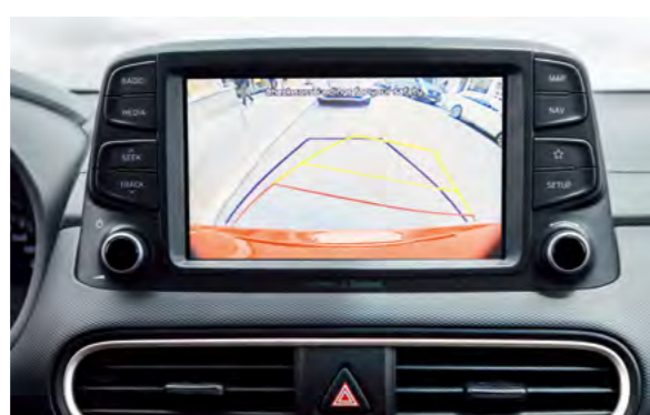
Camera lùi tích hợp