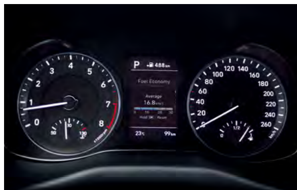
Màn hình thông tin đa chức năng 3,5 inch

Với mức độ hoàn thiện cao, chú ý đến từng chi tiết, Hyundai Kona sở hữu nội thất rộng rãi, tiện nghi và tinh tế. Những điểm nhấn về công nghệ và tính năng giúp bạn có thể cá nhân hóa không gian nội thất trở nên cá tính và độc đáo hơn.