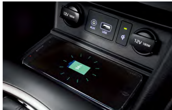
Sạc không dây chuẩn Qi