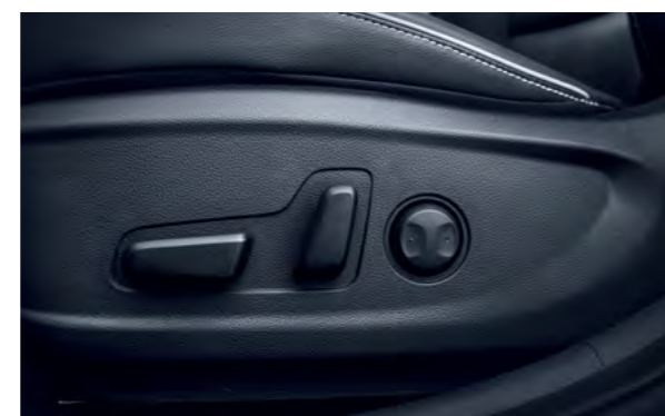
Ghế lái điều chỉnh điện 10 hướng