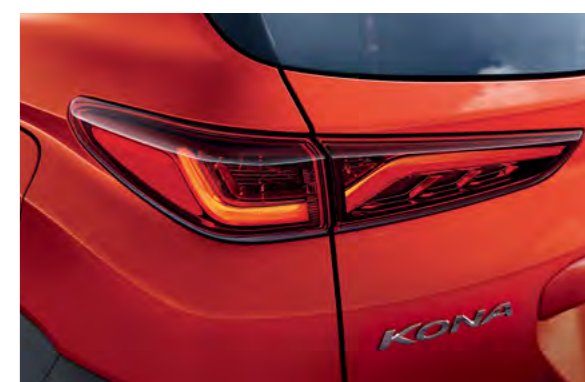
Đèn hậu dạng LED 3D