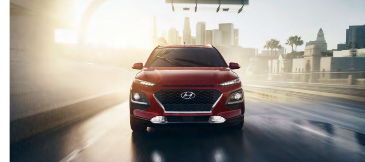
Lưới tản nhiệt thác nước Cascading Grill với các cụm đèn riêng biệt

Kết hợp các đường nét thiết kế táo bạo không kém phần tinh tế, Hyundai Kona tạo nên vẻ gợi cảm từ mọi góc nhìn. Các đường nét góc cạnh kết hợp cùng những chi tiết tạo khối ấn tượng tạo nên một thiết kế SUV mạnh mẽ. Lazang 18-inch Diamond-Cut cùng lựa chọn màu sắc cá tính nổi bật, giúp bạn khẳng định phong cách đậm khác biệt của bản thân.